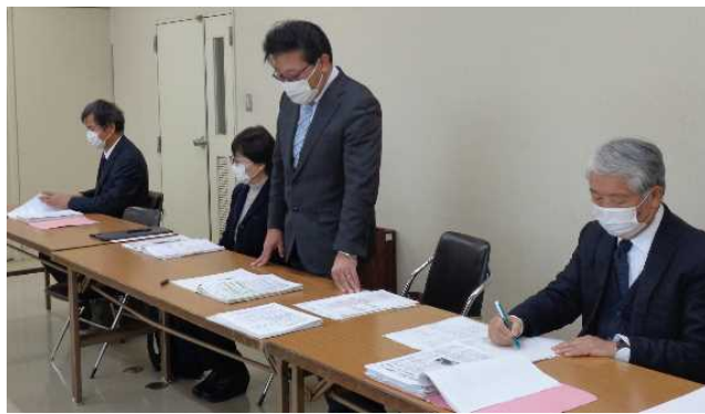
交渉する三観支部代表 仲多度合同庁舎 2.3

所長 基本方針に基づき公平・公正に行っている。交流人事も職能成長、キャリアアステージなど、願いをもって進めている。