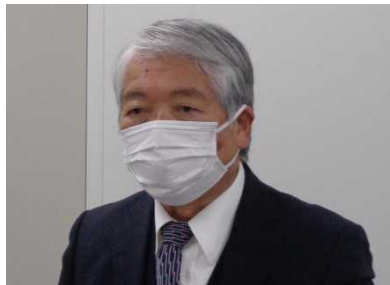
要望する高井副支部長