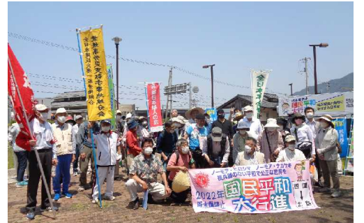
なくそう！核兵器！ 原水爆禁止国民平和大行進 (愛媛県境余木崎、2022.5.22)