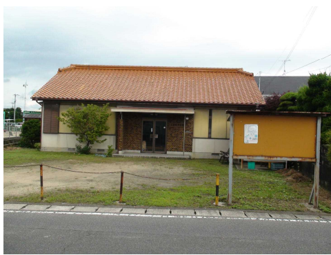
定期大会や支部集会在開催される 三豊教育会館(観音寺自動車学校前)