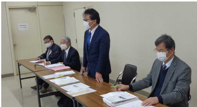
交渉する三観支部代表 仲多度合同庁舎 2.2