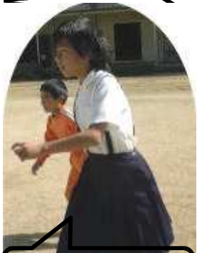
みんな どこにかくれたのかなあ？

秋晴れの昼休み、運動場から元気な子どもたちの声が聞こえてきます。「缶けりしよう！」児童会の呼びかけで、晴れた日は外でみんな遊びます。子どもたちの世界から「群れて遊ぶ」ことが少なくなったといわれていますが、ここ、上西ではまだそんな姿が見られ、嬉しく思います。