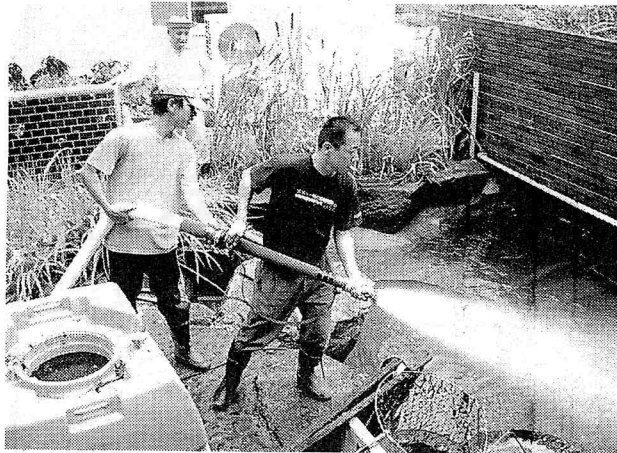
家族も手伝ってくれた奉仕活動。学校の中はきれいに

【塩江町・上西小5年 動をしました。PTAの谷脇愛筆記者】八月二十九日に学校でほうし活