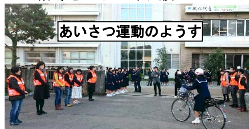
あいさつ運動のようす

11月は、PTAあいさつ運動強化月間として、全員の保護者を対象とする「朝のあいさつ運動」を行いました。朝のあわただしい時間帯ではありましたが、都合をつけて自主的に参加して下さった保護者の皆様、本当にありがとうございました。地域の方々から「中学生が笑顔であいさつをしてくれるのが嬉しい」と、お褒めのことばをいただくようになっています。今後も、ご家庭であいさつのご指導をよろしくお願いいたします。