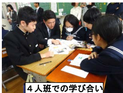
4人班での学び合い